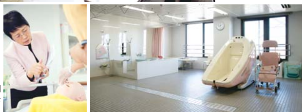
介護実習室や入浴実習室など、充実の施設で実習を行います