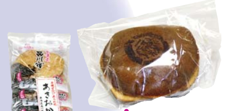
福かさね (銅板手焼どらやき) 一福桃 (北品川12-4-18 ☎070-6552-1210)