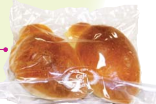
龍馬の足跡パン Café Lotty (東大井2-23-2 ☎3768-4324)