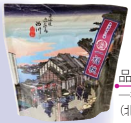
品川かりがね茶 一福桃 (北品川12-4-18 ☎070-6552-1210)