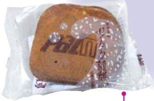
ゼイタク煎餅「パルム」 ゼイタク煎餅重盛の人形焼 (小山3-20-7 ☎3781-8854)