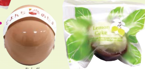
品川はちみつレモンケーキ パティスリー フラフェクレール (南品川11-8-11 ☎5781-9170)

1月23日(土)・24日(日)にきゅりあんで開催する「第26回伝統の技と味/しながわ展」で展示、一部を販売します。