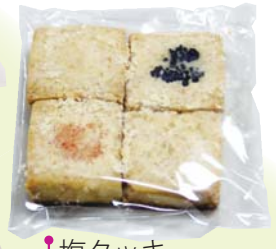
塩クッキー solco (豊町1-3-13 ☎6426-8101)