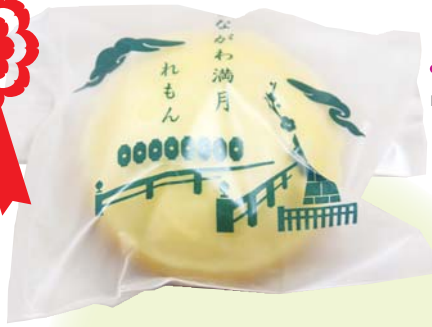
しながわ満月 品川菓匠孝庵 (北品川12-30-27 ☎3471-6395)