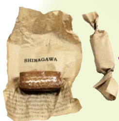
品川白煉瓦 (クッキー) KAIDO books & coffee (北品川12-3-7 ☎6433-0906)

1月23日(土)・24日(日)にきゅりあんで開催する「第26回伝統の技と味/しながわ展」で展示、一部を販売します。