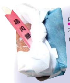
品川餅 木村家 (北品川12-9-23 ☎3471-3762)