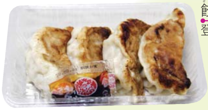
餃子 登龍 (北品川12-4-16 ☎3450-0911)