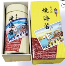
品川屋海苔店 (北品川12-26-19 ☎3471-4649)