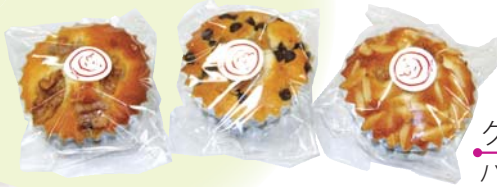
クルミケーキマフィン ハリマヤ (戸越2-7-5 ☎3782-0796)