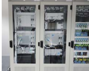
※写真は加速機制御用システムの一部

売上も順調に伸びていますので、新しい技術にもチャレンジし、3年後・5年後の会社運営も考えていかないとけないと思いつつも、あまり深くは考え過ぎず、気楽にでも確実な会社運営で行こうと思っています。昨今のスピード重視・利益重視の経営とは少し異なり、外から見るとじれったい会社運営に感じるかもしれませんが、会社(仕事)の事だけでなく、家族や自分の健康にも留意しないとイケないので、このぐらいのペースで、地道に進めるのが結果的に良いのでは?と自問自答しながら、働いています。