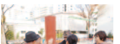
平均台を渡りバランス感覚を養う運動。地域指導員がサポートします

公園の遊具などを使って、軽い運動を行います。太陽の下、体を動かすことを生活の中に取り入れることで、運動機能を維持していきます。