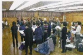
レクリエーションホール（コーラス）