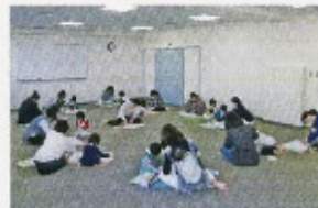
第2講習室（フィットニック）