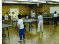
レクリエーションホール (卓球)