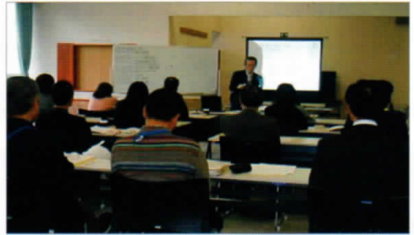
しながわ認知症予防区民ファシリテーターの養成講座

生涯にわたって地域のニーズに関わり、人の想いを実現するような豊かな生き方ができるように「人生の2幕目は面白い！」と多くの人に伝えたいです。