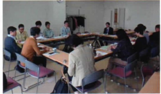
冒険遊び場の懇談会の様子