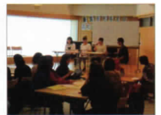
高校入試多言語ガイダンス