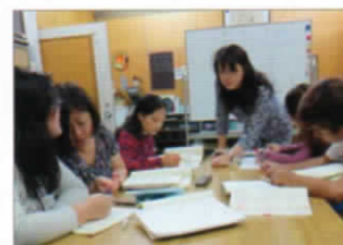
成人の日本語教室

拠点の確保が課題です。小中学生の日本語教室は品川区の委託事業で行っており、山中小学校に活動場所がありますが、高校生や成人の支援を継続的に行える場所の確保が必要だと感じています。以前、ほっと・サロンの方たちに品川音頭を指導してもらったなど、地域とつながることで、とても良い体験が出来ました。これからも区内の協働のつながりをもっと大切にしていきたいと思っています。