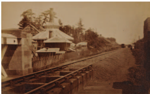
品川硝子製造所