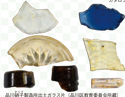
品川硝子製造所出土ガラス片 (品川区教育委員会所蔵)