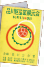
品川区産業展示会カタログ (当館所蔵)