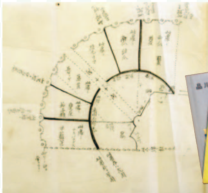
久米邦武実験農場図面 (久米美術館所蔵)