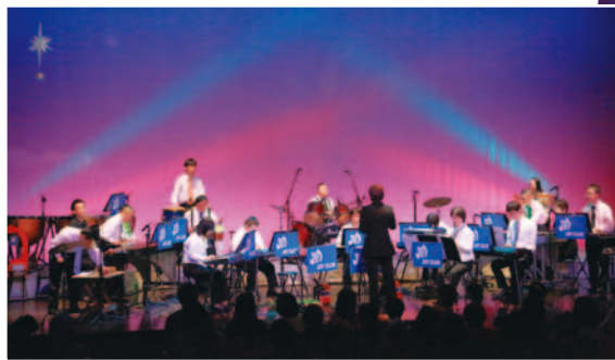
JOY倶楽部ミュージックアンサンブルによる演奏