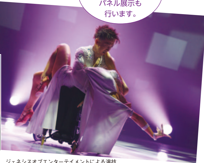
ジェネシスオブエンターテイメントによる演技