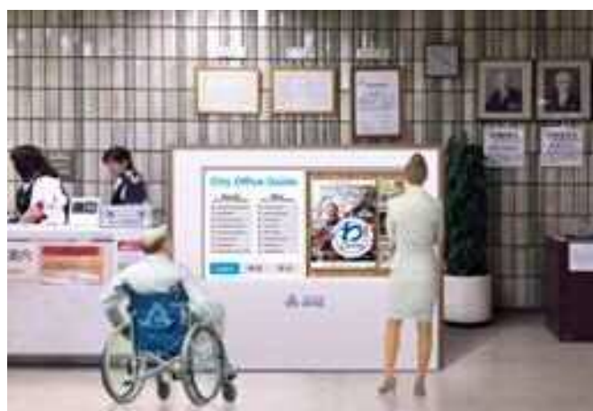
本庁舎のデジタルサイネージ（イメージ）