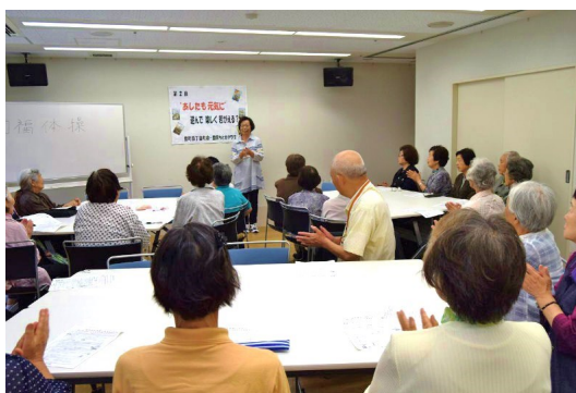
健口体操（誤嚥予防）

「学ぶ・楽しむ」の コーナーは、荏原第五 地区で活動する団体の 紹介をしています。 掲載を希望する団体は 荏原第五地域センター （☎3785-2000）まで