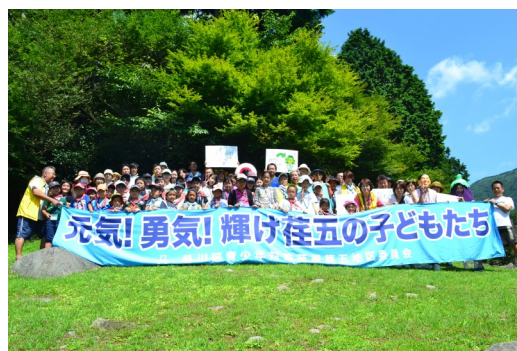
ハイキング&クイズラリー後記念撮影