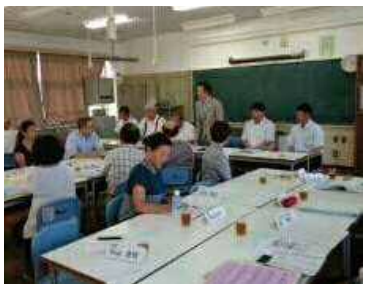
浜川中学校・浜川小学校・鮫浜小学校 校区教育協働委員会の様子

本委員会では、地域の子どもの学力向上や豊かな人間性の育成を図るため、児童・生徒アンケートや学力定着度調査の結果などを踏まえ、自校の課題を見出し、熟議を通してそれを解決するための方策を練っています。