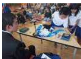
パラリンピアンとの交流 (台場小学校)

都の学習読本やDVDを活用して学んだり、オリンピックやパラリンピアンを学校に招いて話を聞いたりすることで、自分の在り方や生き方を考えるきっかけとしています。