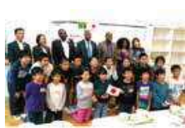
ザンビア大使館との交流 (第四日野小学校、グローバル給食)

「世界ともだちプロジェクト」では、世界の多様性を知り、様々な価値観を尊重することを目指しています。区内の大使館や領事館、姉妹都市や友好都市との交流も一層促進していきます。