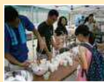
上神明小学校でのぶどう祭り

※各校の実態に応じて、学校支援を行っています。専門的な知識が必要な支援だけでなく、どなたでも気軽に御参加いただける支援もあります。詳細は各校の学校地域コーディネーターにお問い合わせください。