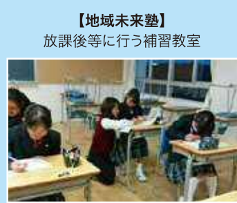
【地域未来塾】 放課後等に行う補習教室