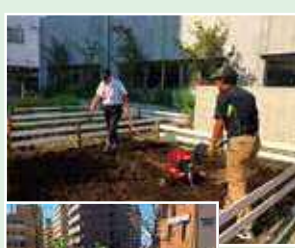
荻原平塚学園での 品川カブ栽培支援