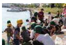
花街道での菜の花の種まき (鮫浜小学校)

環境を支える活動は、大会ボランティアにつながる取組の一つです。清掃活動や花壇づくりなど地域に根差した学校での学びが、東京2020大会にも生かされます。