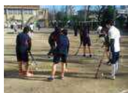
ホッケー体験教室 (富士見台中学校)

平成28年度から4年間かけて区内開催競技、応援競技の体験教室を各校で実施します。体験を通して、競技への興味・関心を高めるとともに、体を動かす楽しさを学んでいきます。