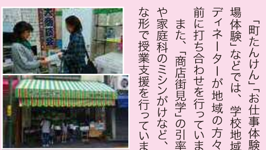
伊藤小学校で行われた 「商店街見学」の引率

「町たんけん」「お仕事体験」「職場体験」などでは、学校地域コーディネーターが地域の方々と事前に打ち合わせを行っています。また、「商店街見学」の引率補助や家庭科のミッションがけなど、様々な形で授業支援を行っています。