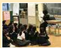
伊藤学園での読み聞かせ