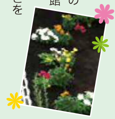
鈴ヶ森中学校の花壇作り