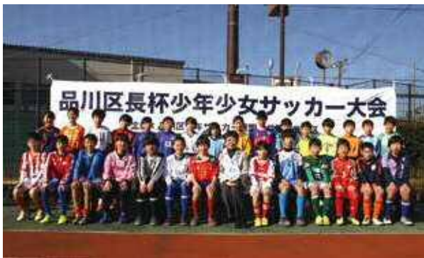
全チームキャプテン