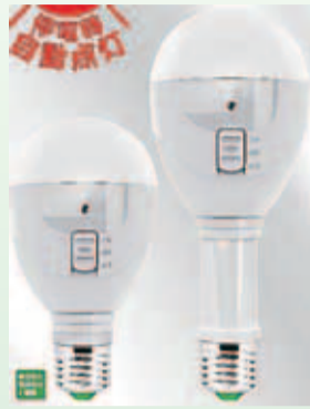
メイドイン品川認定製品 「停電時自動点灯LED電球」

この度、メイドイン品川に認定いただきました「停電時自動点灯LED電球」は、通常時は一般的なLED電球と同じように使用できるが、地震・台風などの災害時に停電が発生した場合には、電球内部に搭載されている電子回路が停電になったことを検出して、内蔵されている電池により自動的に点灯する機能を持っています。