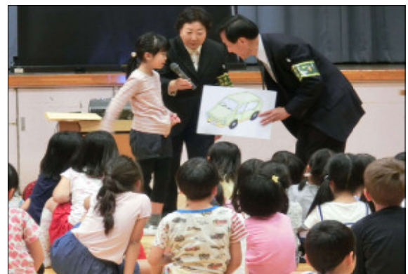
▲実際に不審者に話しかけられた時にどのように身を守るかというロールプレイを行いました。