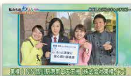
もっと清潔に 安心感と信頼感