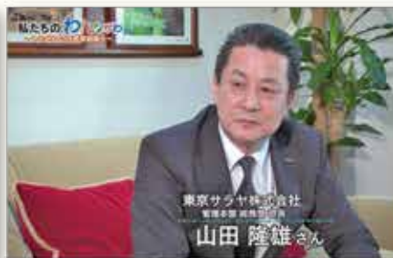
【東京サラヤ株式会社】