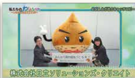
みんなで取り組もう CSR !