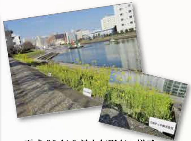
平成 29 年 3 月上旬現在の様子