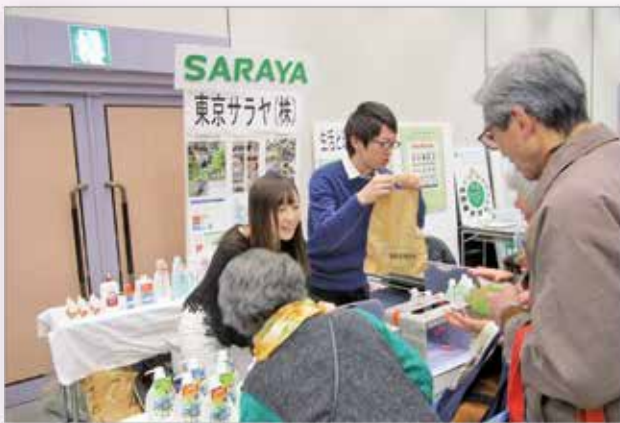
【東京サラヤ株式会社】