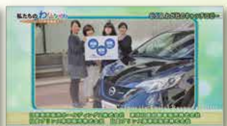
笑顔 smile 元気 energy 誠実 honesty