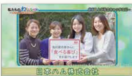
品川区の皆さんに 「食べる喜び」をお届けします