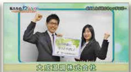
人の呼吸にもっとやさしく