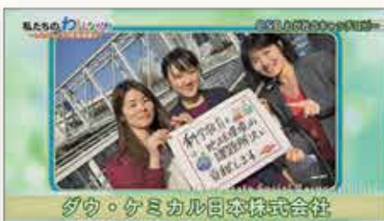
科学教育と地球環境の 課題解決に貢献します