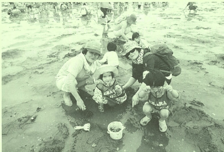
バケツいっぱい採れたよ!

今回の企画も多くの方々の協力のもと、満足していただける企画内容でした。参加されたみなさん、ありがとうございました。(事務局)