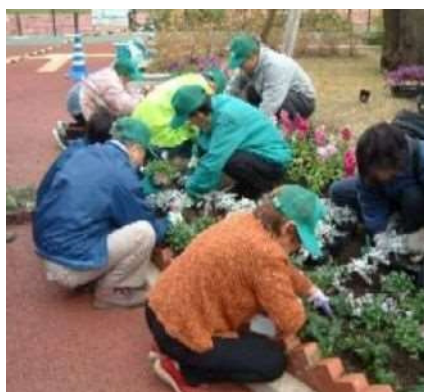
ボランティア活動の様子