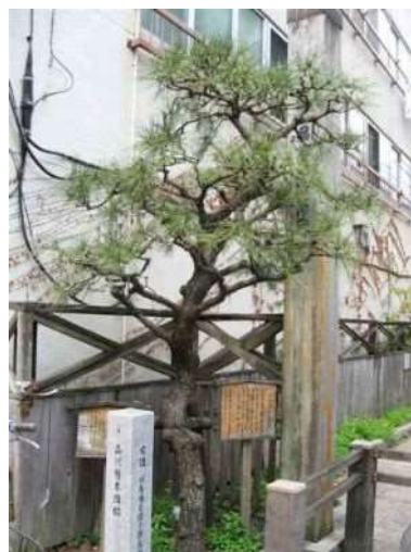
旧東海道周辺に植樹された松 (左：街道松の広場、右：聖跡公園)