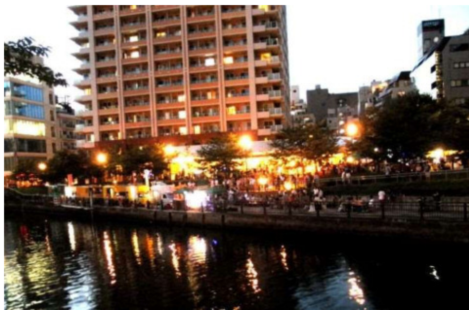
五反田ふれあい水辺広場（目黒川夜市の開催）