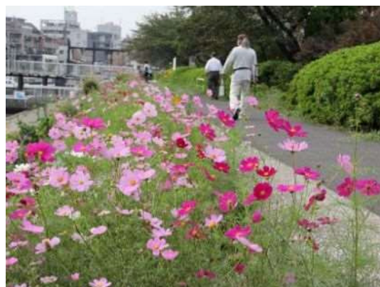
しながわ花海道（春の菜の花、秋のコスモス）