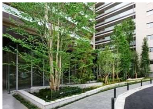
PROUD 大井ゼームス坂（南品川5丁目） （平成25年度緑化大賞受賞物件）