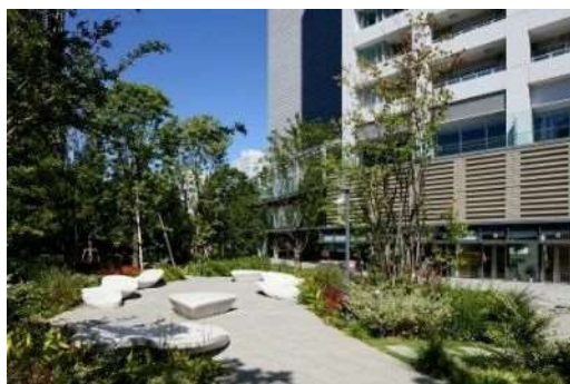
大崎ウィズシティ（大崎2丁目） （平成27年度緑化大賞受賞物件）