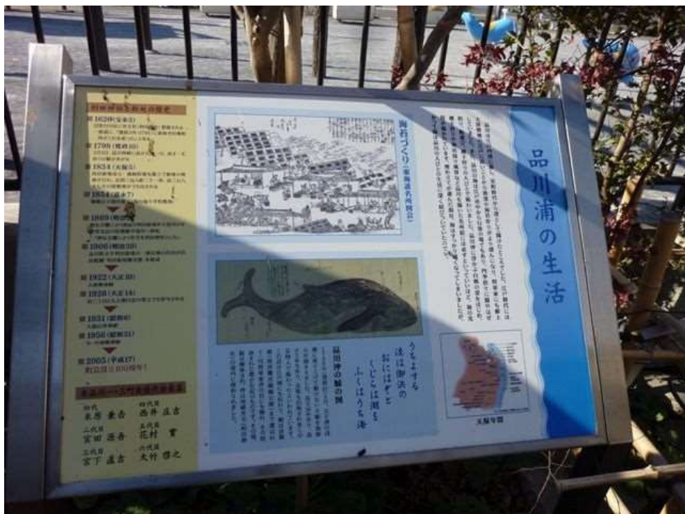
かつての品川浦の生活を伝えるサイン