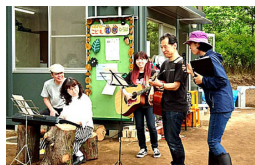
オープニングの生演奏の様子