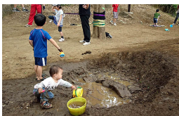
穴掘り、どろんこ、水遊び♪