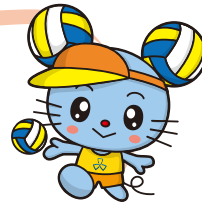
ビーチウ ビーチバレーボール 応援