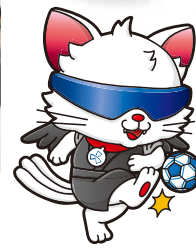
やたたま ブラインドサッカー 応援