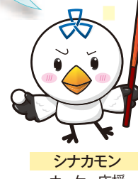
シナカモン ホッケー応援