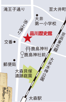
滝王子通り 至大井町 大井第一小学校 品川歴史館 開鹿島神社 鹿島神社前 郵便局 大森貝塚遺跡庭園 大井水神公園 大森駅

10月8日(日)~12月3日(日) 午前9時~午後5時 (入館は午後4時30分まで)