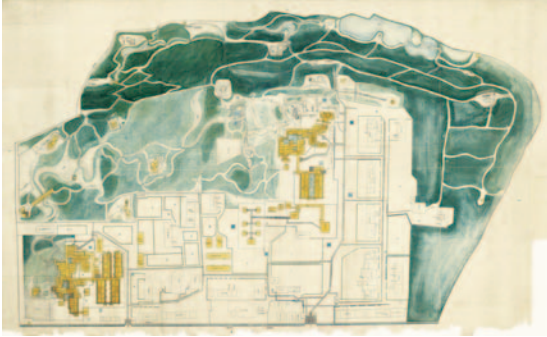
大崎御屋敷分間惣御絵図面(松江歴史館所蔵)

徳川将軍家の鷹場が置かれ、武家屋敷や寺社地が広がった大崎・五反田地区の特色ある歴史を紹介します。