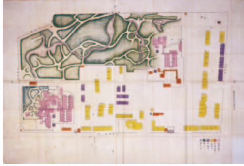
大崎御屋敷絵図(鳥取県立博物館所蔵)