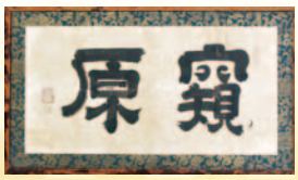
松江藩大崎屋敷茶室席額「窺原」(藤間家所蔵)

休館日/月曜日(10月9日は開館)、10月10日(火) 観覧料/300円、小・中学生100円 ※20人以上の団体は2割引。 70歳以上の方、障害のある方、品川区立の小・中学生は無料。