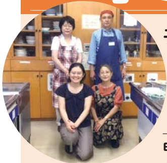
青い空子ども食堂の皆さん

子ども食堂の活動を支援するため、区では「しながわ子ども食堂ネットワーク」を立ち上げました。企業や商店の皆さんの幅広い協力をお願いします。