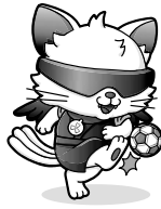
品川区ブラインドサッカー 応援キャラクター「やたたま」

パラリンピック正式競技であるブラインドサッカーの東日本リーグ第5節を開催します。日本トップレベルのブラインドサッカーの試合と一緒に観戦し、選手を応援しましょう。