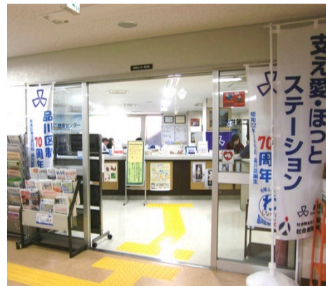
地域センター 平日 8:30~17:00 区民集会所 9:00~21:30 (日・祝日 16:30まで)

皆さん人柄も良くアットホームな職場で、町会の方も温かく職員を受け入れて下さり、とてもよい雰囲気だそうです。小泉所長は、若い層が地域から離れ気味なので町会への関わりを深くしていきたいと思われているようでした。