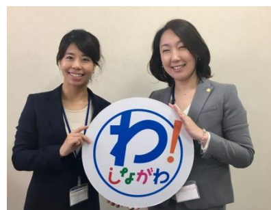
人材アシストマネージャー