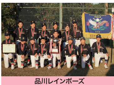
品川レインボーズ