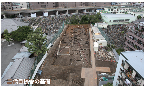
二代目校舎の基礎

その基礎は、きつく固められたローム層の赤土を掘り込み、大きな礫を敷き詰めて、その上にコンクリートを流しさらにレンガを積む