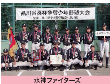
水神ファイターズ