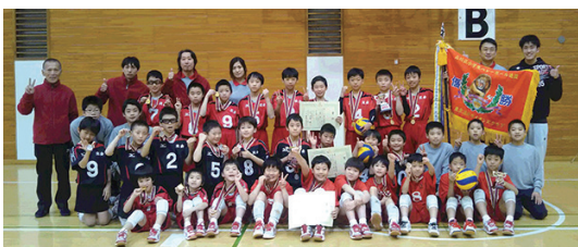
立会アタッカーズ V・B・C(男子A)