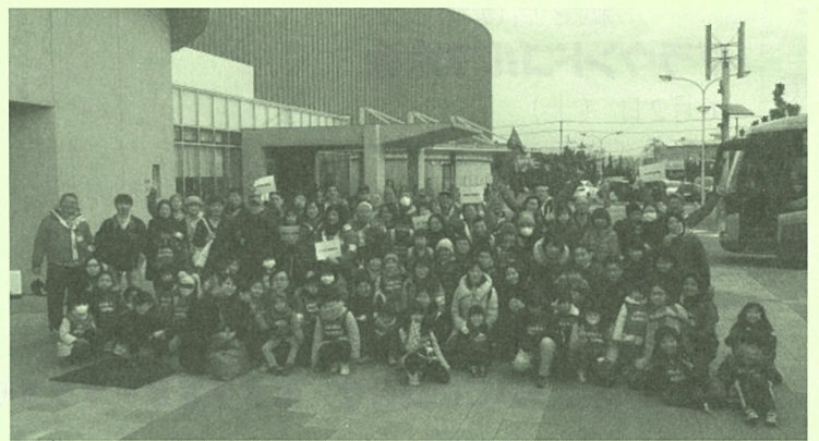
アクアリンクちばにて、参加者全員で記念撮影

今回のこの企画では、「とても楽しかった!」「また参加したい!」という声をたくさんいただきました。ご参加いただいた皆様、ありがとうございました。ご協力ありがとうございました。みな、また一緒に遊ぼうね! (事務局)