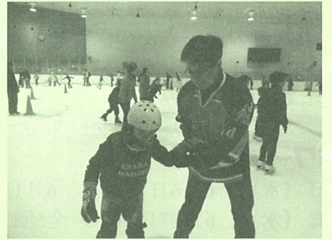
「フォックス」によるスケート指導

参加者は、子ども36名、大人31名、さらに地区委員や事務局を含め、総勢92名。集合は朝の7時15分。武蔵小山からアクアリンクちばに向けてバスは出発しました。車内では楽しそうな子どもたちの声が飛び交い、あつという間に目的地に到着しました。