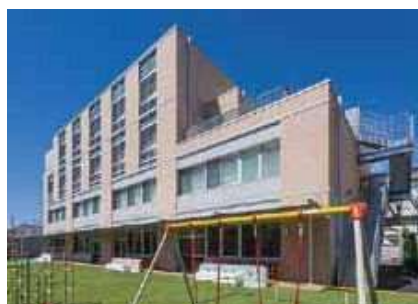
令和3年8月に竣工した浜川幼稚園