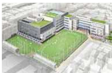
浜川中学校(完成予想図)

このほか、城南第二小学校では現在、改築工事に向けて基本設計を策定しています。 工事期間中は、児童・生徒・保護者・地域の皆さまにご迷惑やご不便をおかけしますが、安全に最大限配慮して行いますので、ご理解のほどよろしくお願いします。