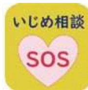
アイシグナルアイコン

ム画面に、相談受付フォームにつながる「アイシグナル」のアイコンが設置され、いじめ等の相談を申し込むことができるようになりました。