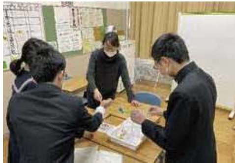
特別支援学級での学習の様子