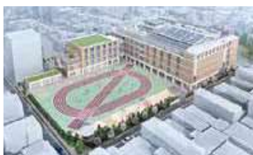
浜川小学校(完成予想図)