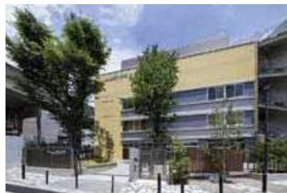
令和3年7月に竣工した鮫浜小学校