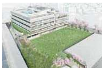
第四日野小学校(完成予想図)