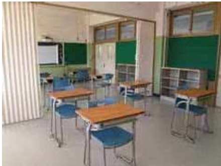
大崎中学校 自閉症・情緒障害 特別支援学級の教室

自立活動では、認知機能を高めるトレーニングや生活の振り返りを行い、自己理解、他者理解を深めたり、ソーシャルスキルやストレス対処法等を学んだりします。