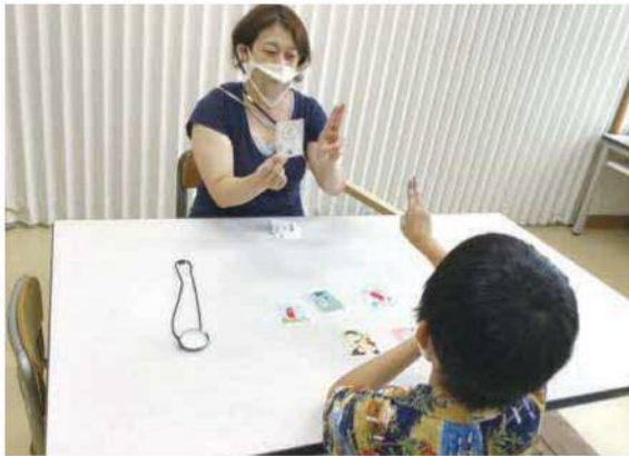
▲難聴通級指導学級の教室（台場小学校）

今後も児童・生徒に寄り添い、発達や障害の状態に応じ、専門性の高い指導を行っていきます。