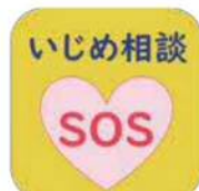
▲タブレット端末のトップ画面にあるアイシグナルアイコン