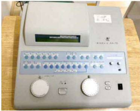
▲難聴通級指導学級で使用しているオーディオメーター（聴力検査機器）

難聴通級指導学級においても、義務教育9年間の一貫した質の高い教育を推進するため、令和6年