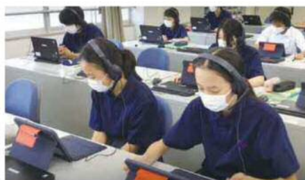
▲授業での様子 (英語・品川オンラインレッスンの様子)

授業では、1年生から9年生まで学年・教科を問わず使用されています。低学年では撮った写真や映像に感想を書き込んだり吹き込んだりすることから始まり、学年が上がるにしたがって、クラウド型授業支援アプリを使って、提出された友達の見返りを見たり、それをもとに話し合ったりする活動が行われるなど、それぞれの学年に応じた活用を推進しています。