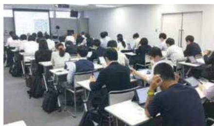
▲教員研修の様子(ICT推進担当教員研修)

今や教育現場では、タブレット端末は必要不可欠なツールになってきているといえます。