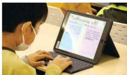
▲校外学習での様子(エコルとごしにて)

撮影した動作を見直して技術の向上に生かすといった部活動や、委員会活動・児童生徒会活動における意見の集約や発表等に用いられています。