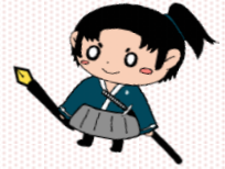
マスコットキャラクター はまりよう