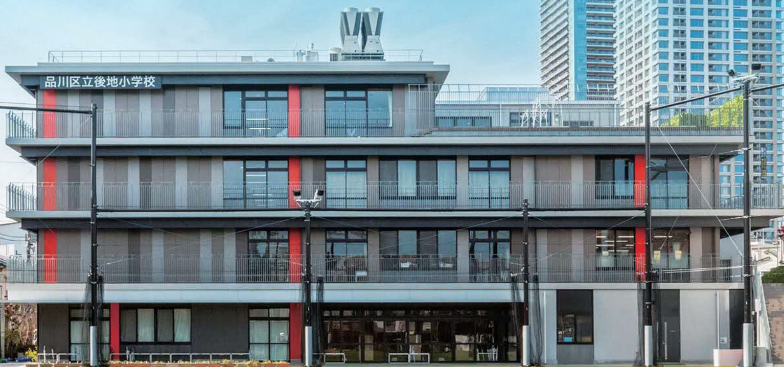
品川区立後地小学校