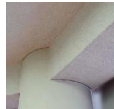
吹付けパーライト