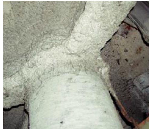
吹付けアスベスト