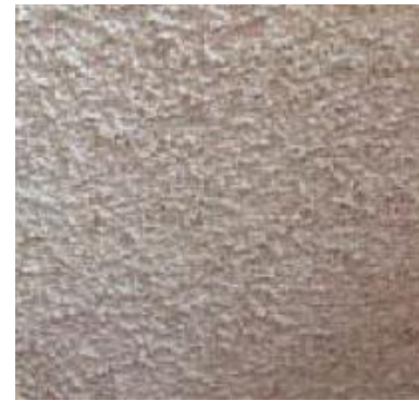
吹付けバーミキュライト