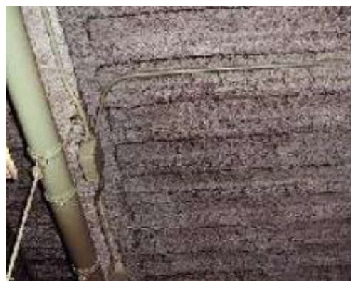
石綿含有吹付けロックウール