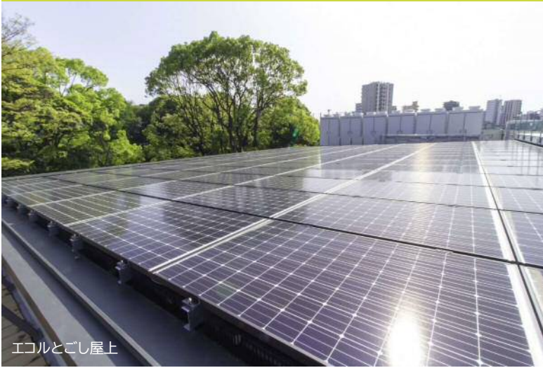
エコルとごし屋上