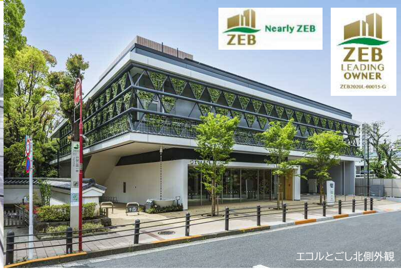
エコルとごし北側外観