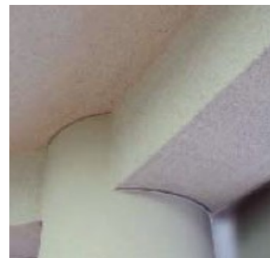
吹付けパーライト