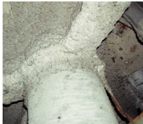
吹付けアスベスト