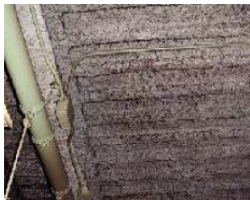
石綿含有吹付けロックウール