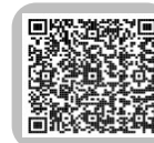
PDFでご覧になる方はこちら