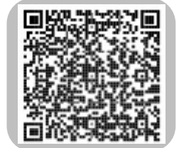
PDFでご覧になる方はこちら

*品川区では療養生活、福祉サービス、交流会等についてのご相談を随時お受けしています。お住いの住所の管轄保健センターに、お気軽にご相談ください。