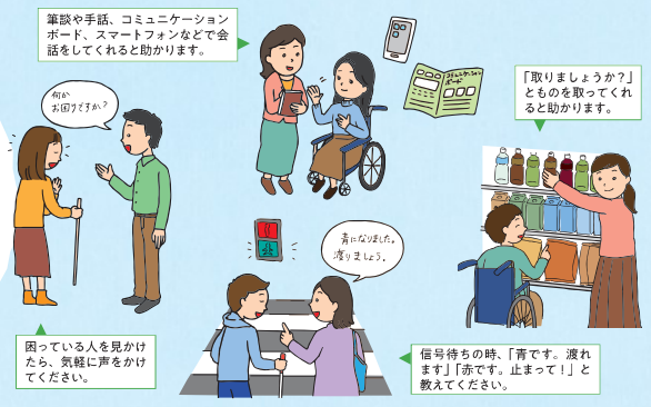
困っている人を見かけたら、気軽に声をかけてください。

困っている人を見かけたら、声をかけ、本人の意思を確認しながら、必要なサポートをしましょう。あなたのちょっとした声かけや行動で助かる人がたくさんいます。まずは「何かお困りですか？」「何かお手伝いしましょうか？」と尋ねてください。