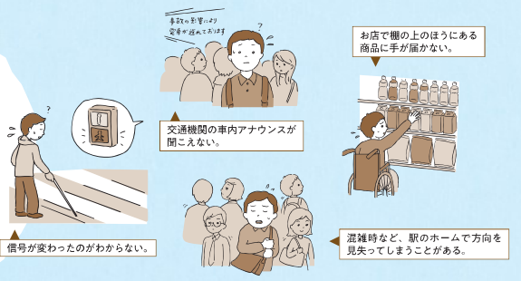
信号が変わったのかわからない。

障害は、生まれた時からある人もいれば、病気や事故、あるいは年をとることによって発生する場合もあり、誰にでも生じる可能性のある身近なものです。また、障害の種類やその人ごとの症状や程度、そしてその人がいる場面や状況ごとに不便さや困難さが違います。周囲の人の理解やサポートがあれば、不便さや困難さを感じずに済むことがあります。 最近、新型コロナウイルス感染症の影響で声かけやサポートが減っています。