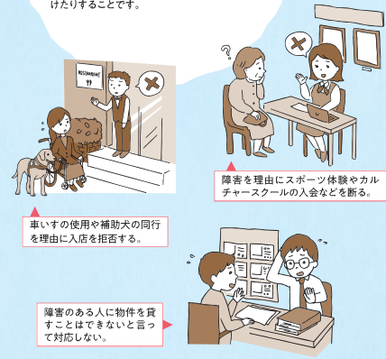
車いすの使用や補助犬の同行を理由に入館を拒否する。

障害のある人に対して、正当な理由なく、障害を理由として、サービスの提供を拒否したり、制限したり、障害のない人にはつけない条件をつけたりすることです。