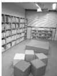
◀子育て支援コーナー (五反田図書館)