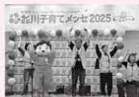
◀きゅりあんで開催 「品川子育てメッセ2025」