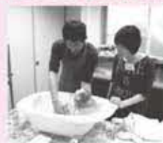
両親学級で 沐浴体験