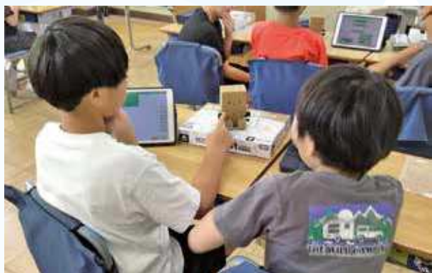
コミュニケーションロボットを使ってプログラミング学習を行っている。