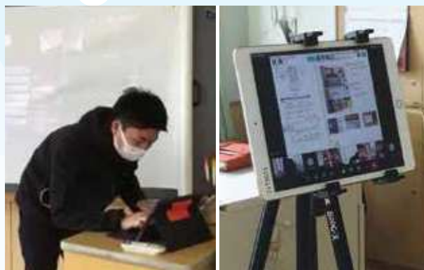
休校時のオンラインによる授業の様子。長期欠席時の家庭学習にも対応。