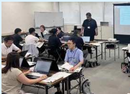
区によるICT関連研修会の様子。

また、一人ひとりの取組状況に応じた出題ができるAIドリルや、オンラインテストアプリの使い方、校務における生成AIの活用方法等、社会の変化に対応し、随時教員研修の刷新を図っています。