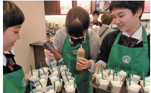
キャリア教育(職場体験)