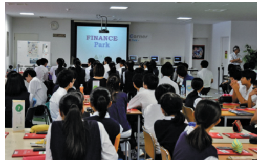
ファイナンス・パークの授業