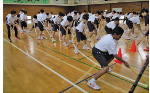
オリンピック競技の体験