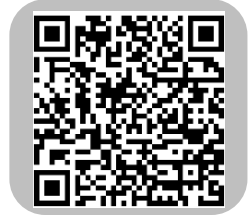
PDFでご覧になる方はこちら

*品川区では療養生活、福祉サービス、交流会等についてのご相談を随時お受けしています。お住いの住所の管轄保健センターに、お気軽にご相談ください。