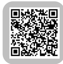
PDFでご覧になる方はこちら