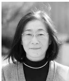
立正大学 心理学部 臨床心理学科 教授 ガイダンスカウンセラー 認定カウンセラー 上級教育カウンセラー