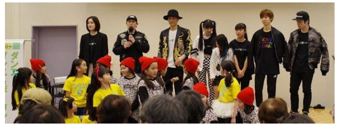
オープニングセレモニーを担当した「しながわ学院エンタ部」子ども達のダンスとボーカルで会場を再び沸かせました。