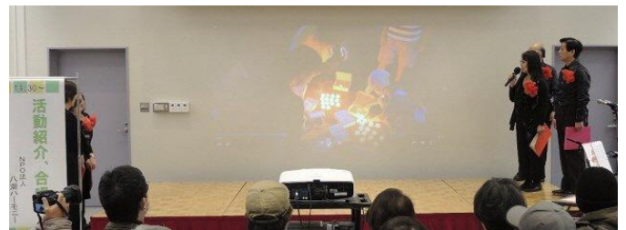
「八潮ハーモニー」前半は多彩な活動を紹介。後半は合唱を披露しました。