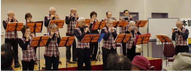
「大井ハーモニーメイツ」がトップバッター。ハーモニカによる、優しい音色の演奏です。