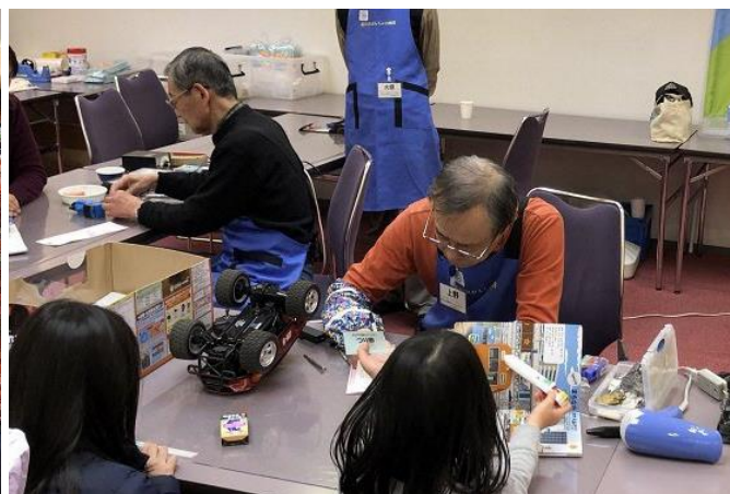
「ちゃんと、なおるかなあ」(おもちゃの病院にて)

2019年2月23日(土)、大井町「きゅりあん」にて、『地域でつながるみんなの暮らし展2019』が開催されました。品川区で活動するNPO法人、ボランティア団体、町会・自治会、大学、企業のCSR部門など、さまざまな分野の人たちが集まり、日頃の活動を展示・発表す