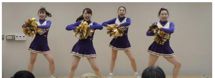
「清泉女子大学チアリーディング部 S.S.S. (スリーエス)」今年はフィナーレを盛り上げました。