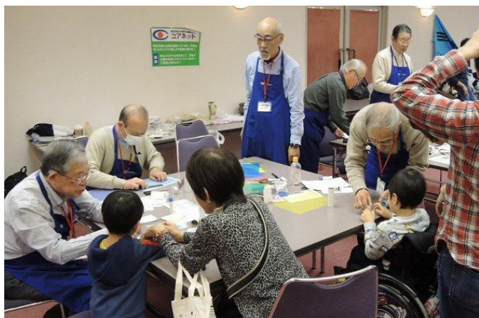
ものづくり教室も盛況でした