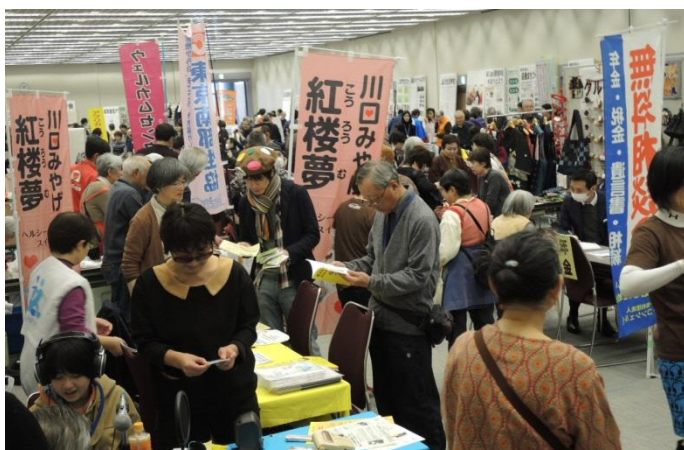
出展者・来場者で交流が生まれ、会場は大賑わい