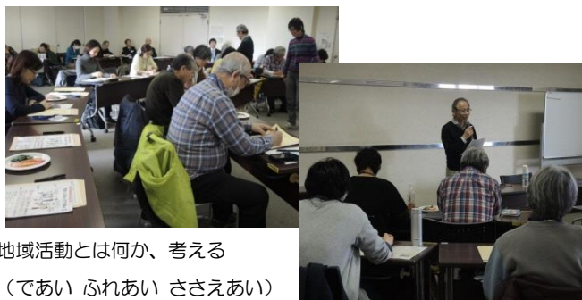
地域活動とは何か、考える (であい ふれあい ささえあい)

地域活動は、その団体のメンバーだけでなく支援者がいなければ成り立ちません。団体内にはもちろん、外に対してもビジョン・ミッションをわかりやすく示して、団体内外の志を共にする人に支えられる団体であろうとすることの大切さが身に染みて理解できました。参加者からは、講座後、組織基盤整備に取り組み始めたという報告もあり、大変有意義な講座でした。