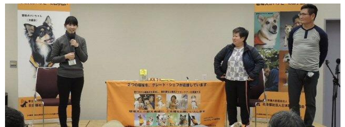
「人工聴覚情報学会」みなさん、聴導犬って知ってますか？聴覚障害の方の生活を支えています。