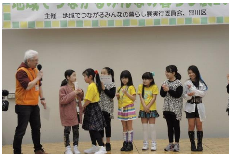
「わ！しながわ活動賞」を受賞したしながわ学院エンタ部のみなさん。

今年の“わ！しながわ活動賞”は、出展団体みなさんによるアンケート結果をもとに決定されました。ユニークで社会的意義のある活動として選ばれたのは「しながわ学院エンタ部」のみなさんでした。おめでとうございます！