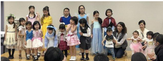
「リメママ」の、おとなの服をリメイクした衣装によるファッションショー