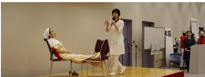
「プラチナ美容塾」このような美容術をみんなで身につけて、プラチナ世代のみなさんを輝かせています。