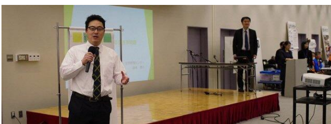
「空家・空地管理センター」空家と相続について発表。空家や相続で困っている方、お気軽にご相談ください。