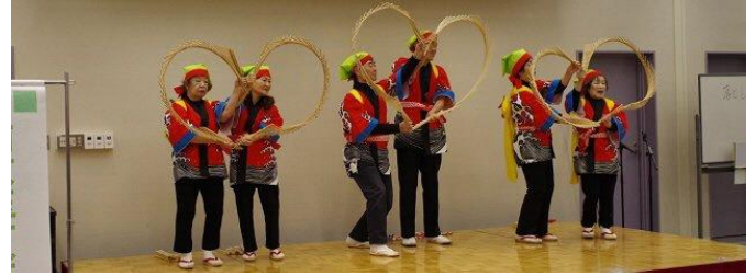
「喜楽会」みんなの息があった南京玉すだれの芸をご覧ください。