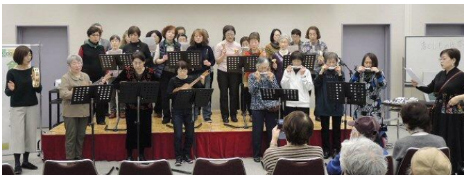
「うえるかむ楽団」観客のみなさんと一緒に演奏。曲を重ねるほどに、会場がとても盛り上がりました。