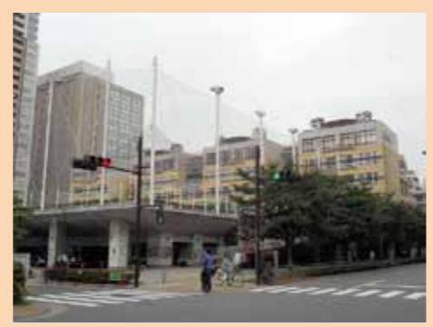
全国初の施設一体型小中一貫校 日野学園