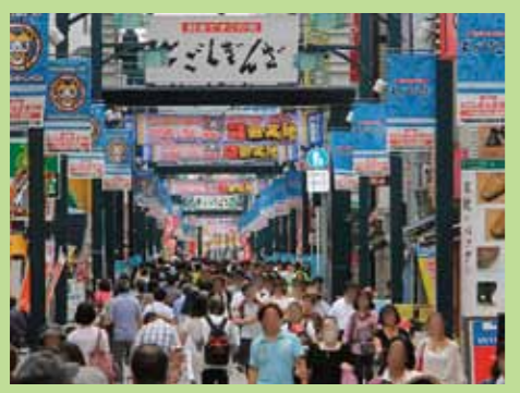
都内最長 1.3km を誇る商店街 戸越銀座商店街