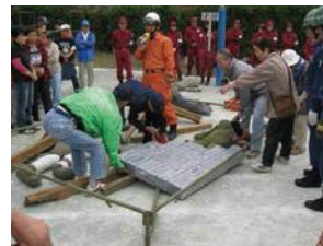
倒壊家屋からの救出訓練

毎年9～11月に各地区防災協議会と共催して、総合防災訓練を実施しています。訓練を通じて、応急救護や初期消火など、いざというときの対応を身につけることができます。