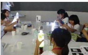
家庭・区民コース