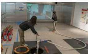
スタンドパイプ体験

平成28年3月に、体験型の施設としてリニューアルオープンしました。防災展示、初期消火、応急救護、要配慮者避難誘導、避難姿勢、防災体験VR、シアター・ワークショップルームの7つの体験ブースがあり、初期消火のブースでは、スタンドパイプや屋内消火栓で実際に放水ができます。