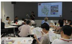
防災区民組織コース

「防災区民組織」「事業所」「家庭・区民」「防災カフェ」「地域実践」の5コースを開講。さまざまな講義や体験を通じて、防災に関する知識や技術を習得し、地域防災力を向上させる人材として、「しながわ防災リーダー」を育成します。