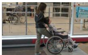
要配慮者避難誘導体験