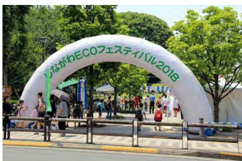
今年のエコフェスの様子

「しながわECOフェスティバル2018」に清泉女子大学も参加してきました！私たちしながわ大学連携推進協議会のブースでは、それぞれの大学を関連させたエコクイズをポスターで掲示し、そのクイズ正解者にはヨーヨーすくいをやって頂くという内容の出し物をしました。天気も良く沢山の方々が立ち寄り下さり盛況に終わりました！来年の「しながわECOフェスティバル」も参加を予定しておりますのでお時間があれば是非お越しください。お待ちしております！