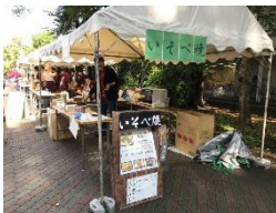
クリームシチュー