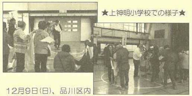
★上神明小学校での様子★

12月9日(日)、品川区 46か所の避難所で訓練 が行われました。荏原第四地区では大原小学校・上 神明小学校で実施されました。