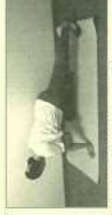
腰痛に効果的なポーズ 脚は肩幅で肩の下に手がくぐるように四つん這いになる。片足を伸ばし、かかとを踏み込むようにしてふくらはぎを伸ばしてキープ