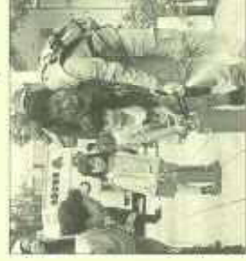
↑気軽に参加できる防災訓練

地域の防災行動力向上のため「まちかど防災訓練」体験乗車用はしご車、「VR防災訓練車」等の体験イベントや町会や高齢者クラブの防災講話に消火器の取扱訓練を取入れた、どこでも、いつでも、誰でも参加できる訓練の推進活動を行っています。