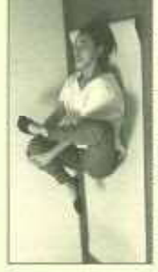
腰痛に効果的なポーズ 右の膝を右の胸に引き寄せる。吐くことを意識して呼吸。(反対側も同様)