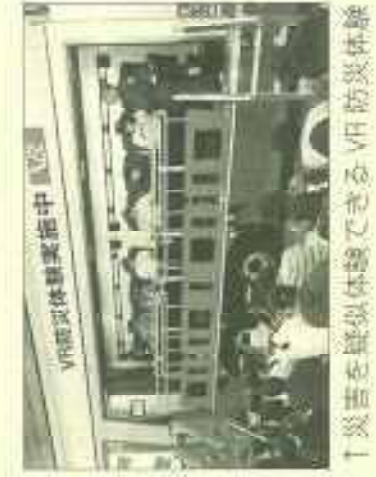
↑災害を疑似体験できるVR防災体験