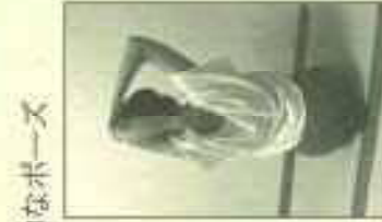
両こりに効果的なポーズ 中指が背中へ触れるように腕を倒し、右に少し倒すことで左の肩が伸びる。ピルリしてきたら、腕を下ろして血流の流れを感じる。(反対側も同様)