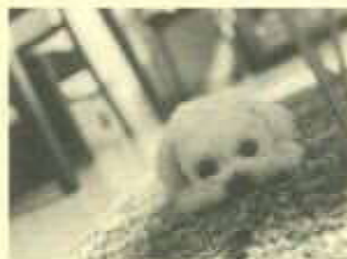
戸越6丁目 吉井さん宅 マルチース ショーくん