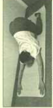
腰痛に効果的なポーズ 腕をマット幅に広げ、脚を床に近づけるように降りていく。胸をひらく。