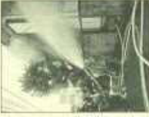
↑災害現場での活動

実際の災害現場に年に数度は出動します。消火活動以外にも周囲の人の整理や声掛けもします。