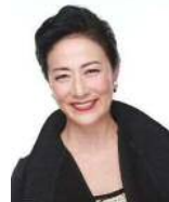
高汐巴 元宝塚歌劇団 花組トップスター