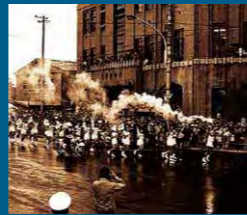
1964年 東京オリンピック聖火ランナー Tokyo Olympic torch runners

大森海岸駅から浜川中学校前、旧品川区役所前(現品川保健センター)、大崎陸橋を経て目黒区へ。写真は旧品川区役所前。