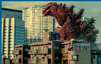
2016年 区内を縦断するゴジラ Godzilla travels the length of the city

Runners carried the torch from in front of Omorikaigan Station to Hamakawa Junior High School, the former Shinagawa City Office (present-day Shinagawa Health Center), and Osaki Overbridge to Meguro City. The photo was taken in front of the former Shinagawa City Office.