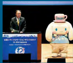
2017年 全国シティプロモーションサミット2017 National City Promotion Summit 2017

After coming ashore from Tokyo Bay, Godzilla walked on 2 legs from in front of Shinagawa Station. He squared off against a Self-Defense Forces helicopter at Yatsuyama-bashi (in the movie, "Godzilla Resurgence").