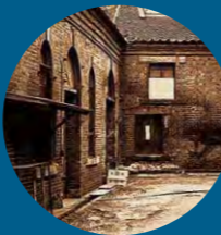
官営品川硝子製造所 (1960年代中頃) Government-operated Shinagawa Glass Factory (mid 1960s)