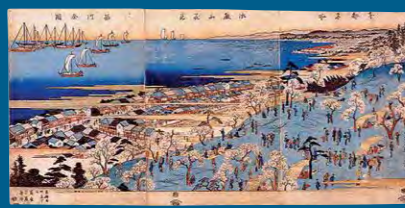
東都名所 御殿山花見 品川全図: 歌川広重(初代) Utagawa Hiroshige (the First) Famous Places in the Eastern Capital: Cherry Blossom Viewing at Gotenyama in Shinagawa