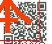
「接種予約フォーム」 二次元コード