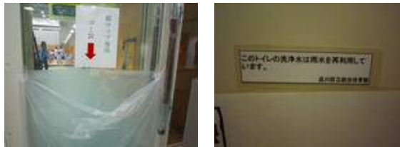
紙コップ専用ごみ袋