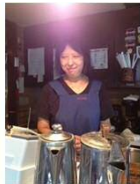
おしなちゃん（FC東京）