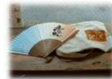
エコ素材で作った 周年記念品