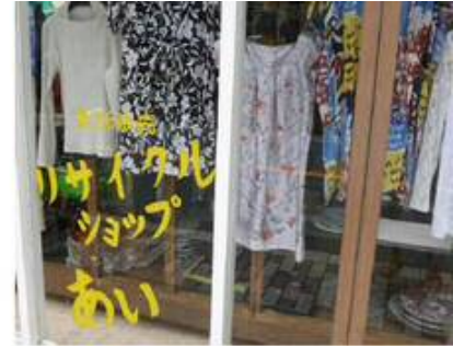
お店のショーウィンドー