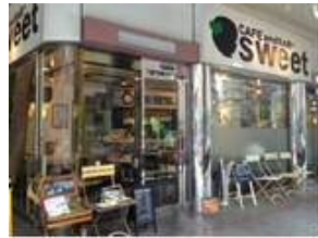
店 (SWEET) 全景