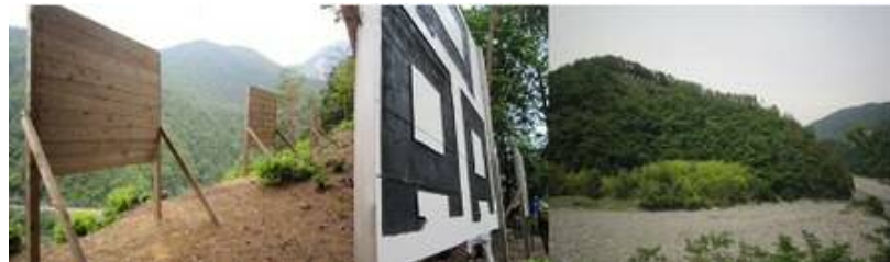
「マウントしながわ」看板 「品」の文字 バスから見た「マウントしながわ」

ハイキング、古いお寺や古い街並みの見学、硯の工房見学、はやかわトラねこ市、マウントしながわ登頂、など大変盛りだくさんの行程で充実した2日間でした。梅雨の時期でしたが、お天気にも恵まれ、自然に親しみ、楽しく過ごせました。私が早川町に来たのは、今回で2回目、25年位前北岳から農鳥岳へ続く白根三山縦走登山の時でしたが、あまり変わっていない印象です。それは自然が美しいまま、保たれているからでしょうか？ボランティアの方が「田舎がないから、自分のふるさとと思っている」とおっしゃっていたのが印象に残りました。日本ミツバチの巣箱があり、お茶も無農薬で栽培され、「日本で最も美しい村」連合の加盟町村、早川町へ皆さんも行ってみませんか？