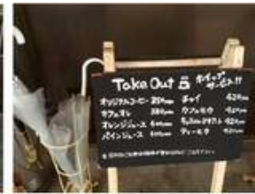
テイクアウトもできます