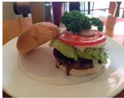
テリヤキバーガー

全世界では、食糧不足で十分に食せない人も多く、使い捨ての様な事は避けなければならない。「知る・考える・行動する」が原点であるとおっしゃっています。おいしく、楽しく、健康に貢献したいお店として、発信されているのが印象的です。