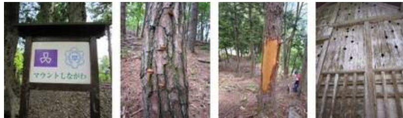
入口の看板 樹に生えたきのこ シカにかじられた跡 糞の開けた穴

「マウントしながわ」に登ってみると、ところどころ道が荒れていて歩きにくい箇所もありましたが、15分くらいで山頂に到着。「マウントしながわ」の看板は長い板を重ねて作っており、担ぎ上げるのはさぞかし大変だったのでは？と感じる大きさでした。松の樹はマツクイムシの被害にあって倒れ、木肌は鹿にかじられた跡がありました。土砂崩れで荒れた道が少し残念です。それでも茂ったたくさんの草、木に生えたきのこ、鳥のさえずり、など見るものは多く、新緑に輝く草の匂いに大自然を感じました。木の上部に仕掛けた巣箱にはシジュウカラなどの鳥が棲み、世代も交代しているそうです。「マウントしながわ」に向かう道にも自然があふれていました。