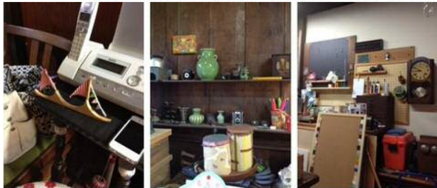
(工房内)端材で作ったヨット、陶器類、骨董品ほか 「ハレルヤ工房」