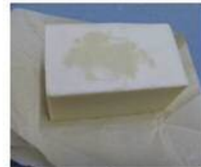
ハンドメイド石鹸

「TETEアロマテラピーサロン」 品川区東大井5-5-8 フクヤビル3 F TEL：03-3765-2953 HP：http://www.tete-aroma.com/