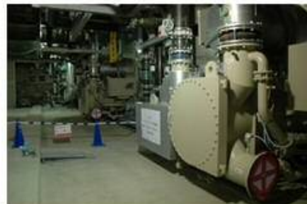
東京ウォーカー (全国版)より

地域冷暖房とは、エネルギープラントで冷水や温水などをつくり、一定地域内の複数の建物に配管を通して供給する冷暖房・給湯システムです。個別熱源方式（個別の建物毎に冷暖房設備を設置）と比較して大きなメリットがあり、省エネにつながります。このシステムの採用により、個別熱源方式に比べ年間CO2排出量を48%削減することができたとのこと。