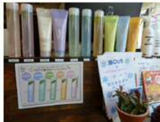
石油系の界面活性剤が含まれていない シャンプー