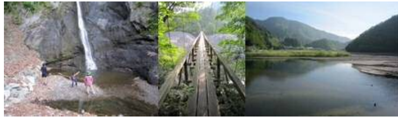
見神の滝に到着（落差 55m） 雨畑川にかかる吊り橋（定員1名）と雨畑湖

「マウントしながわ」は山梨県早川町京ヶ島地区にある、標高482m、約4万 \diamond の小高い山で、自然と親しむ活動の場、ふるさとの山、まるごと自由に使える里山として、早川町から無償提供されたもの。品川区民が調査、利用計画を作り楽しみながら里山づくりを目指しています。