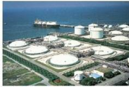
袖ヶ浦工場 世界最大級のLNG基地