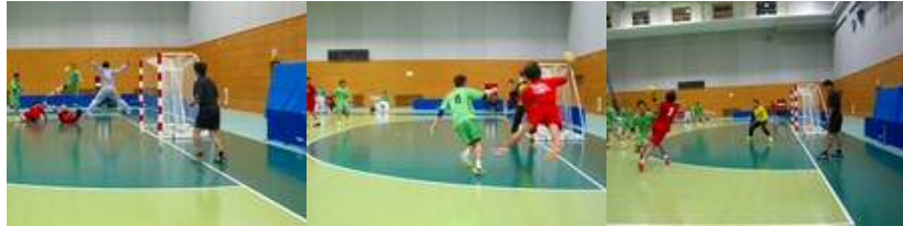
試合風景「佐賀県対宮城県」結果は宮城県が32対28で勝利しました