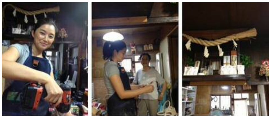
オーナーの作業 常連さんと話します (工房内)品川宿らしく神棚が

たまごを 食べると 元気になる。 たまごは いろいろな国で食べている。 たまごは 煮ても 焼いても 蒸しても食べられる 主食にもなるし 姿を消して つなぎという見えないけど 大切な役目もする おかずにもなるし 一品足りない時 ササッとつくれて 彩りもきれい たまご わたしは たまごが だいすき