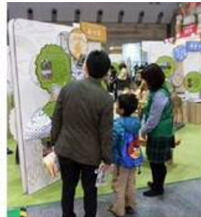
品川区のコーナー