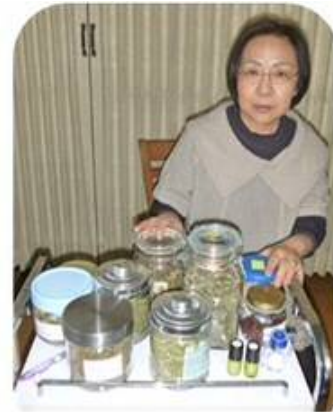
ハンドメイド石鹸