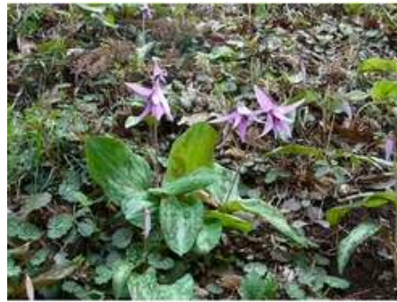
2013. 3. 26 (千葉県柏市のカタクリの自生地)

このような植物は「スプリング エフェメラル」と呼ばれます。“春の妖精”と訳されますが、エフェメラルは、はかないものの形容です。